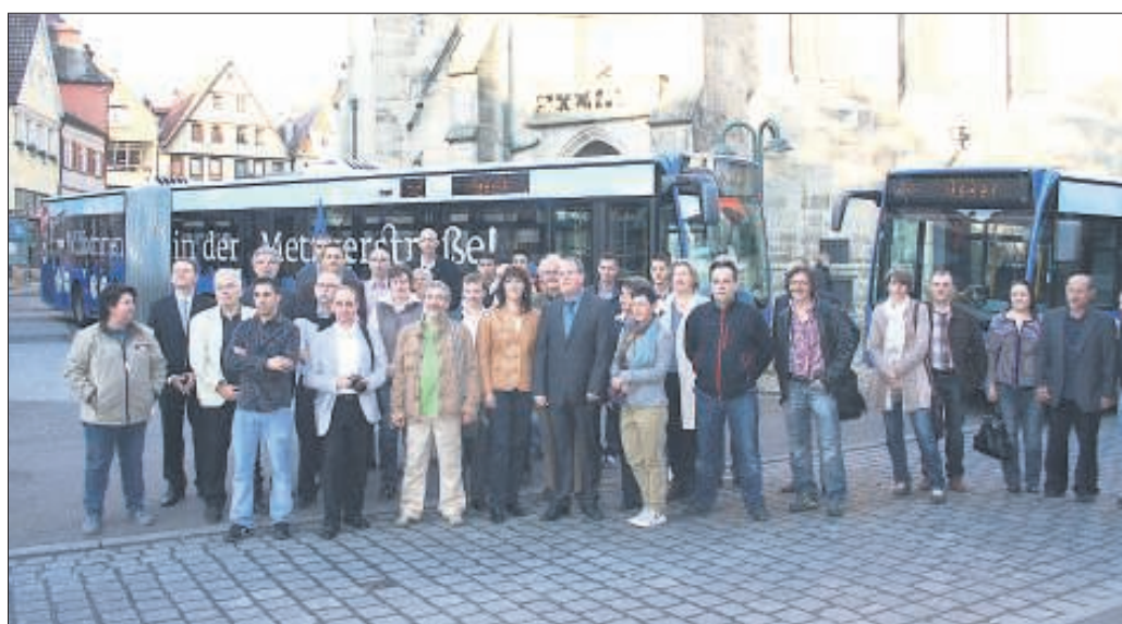
Die Mitglieder des Vereins Metzgerstraße vor den zwei neuen Gelenkbussen. Am Dienstag war Bustaufe.